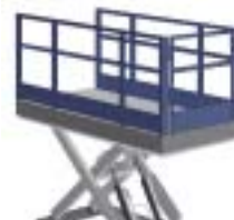
Räcke & Grind