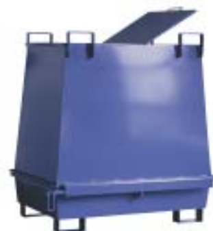
BTC-1000 med lock

OBS! Max tillåten totalvikt = jämnt fördelad last